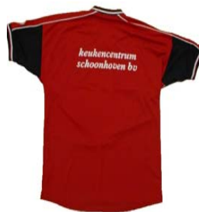
Het nieuwe tenue

In de vorige uitgave van het clubblad zijn de foto's niet helemaal duidelijk overgekomen. Daarom nogmaals deze foto's om u te laten zien dat ze wel de moeite waard zijn.