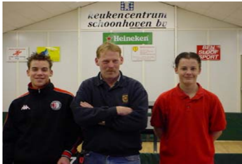
“Babbeltje met “Jan van Randwijk